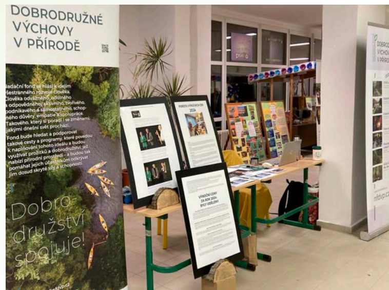
Prezentace Fondu na 8. národní konferenci EVVO a na CVVZ 2025 · Nadační fond dobrodružné výchovy v přírodě

Vypracovali jsme strategii rozvoje fundraisingu, která má tři pilíře: drobné přispěvatele z veřejných kampaní, patronství nadačního fondu a strategické dlouhodobé partnerství . Připravili jsme potřebné materiály, navázali spolupráci s důvěryhodnými donátorskými platformami a přivítali jsme v našich řadách šest nových patronů. Oslovili jsme řadu kandidátů pro dlouhodobé partnerství a pokračujeme v jednání s nimi.