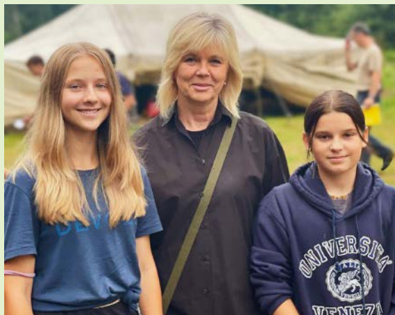
Eva Pavlová, City Camp · Outward Bound CZ

S potěšením jsme na závěr roku přijali zprávu o 14 uskutečněných projektech (mezi nimi tři expedice, z toho dvě školní). Jako velice životaschopný a perspektivní se ukázal projekt příměstských táborů City Camp . Ty se – společně s tradičními tábory OB Camp – konaly pod záštitou manželky prezidenta České republiky paní Evy Pavlové.