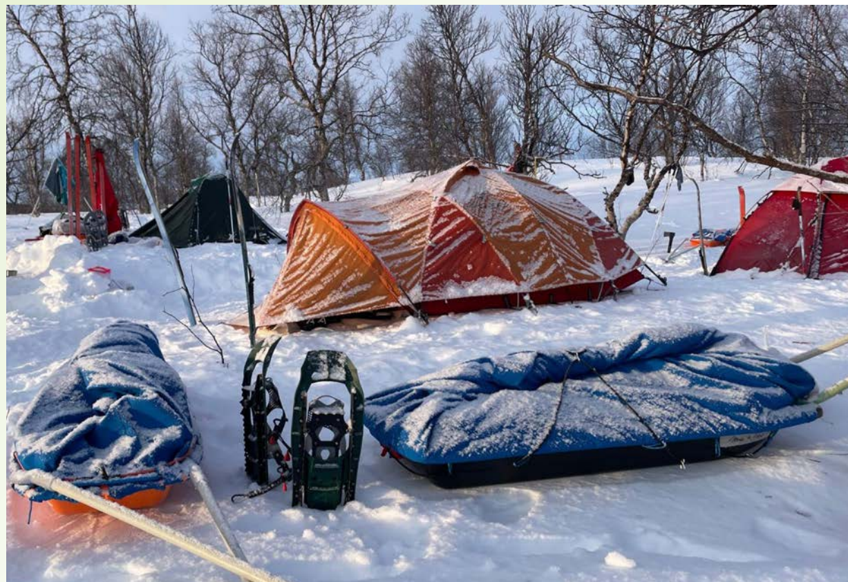
Skandie 2025 · Outward Bound CZ

V letošním roce tak nešlo oproti letům předchozím o podporu expedic a nákup dalšího materiálního vybavení pro outdoorové projekty. Finanční podpora mířila na první kroky k profesionalizaci kanceláře spolku – a touto cestou na pomoc při produkci plánovaných projektů. Jako podporu spolku vnímáme také zapojení čtyř patronů fondu do činnosti správní rady OBCZ.