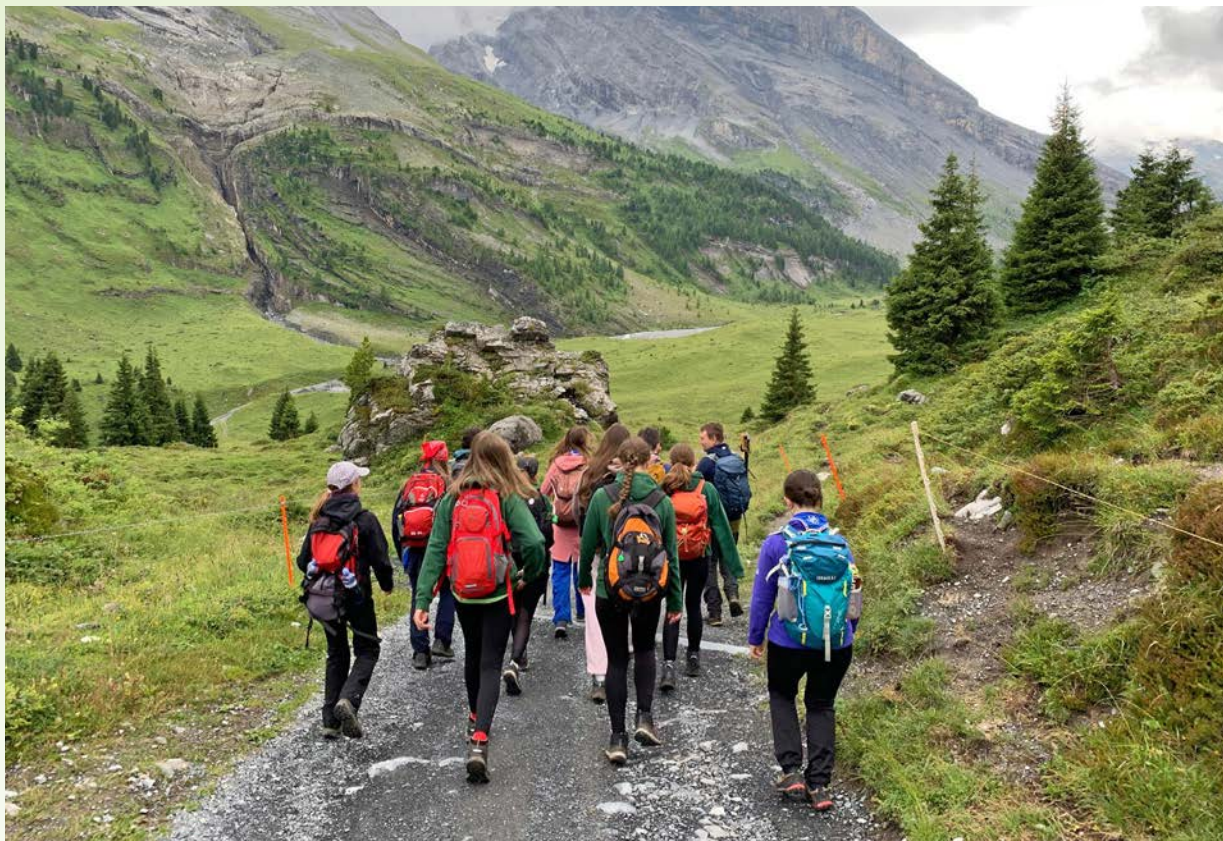
Dívčí výprava do Švýcarských Alp · Junák – český skaut, středisko Havran Klecany

Vytváříme strategická a dlouhodobá partnerství s jednotlivci i s organizacemi, které v dobrodružné výchově spatřují stejné přínosy. Řešíme významný společenský problém – nedostatek odolnosti, odvahy a ochoty riskovat – a taková ambice vyžaduje adekvátní a spolehlivé finanční záležitosti. Děkujeme všem partnerům, kteří nás podporují.