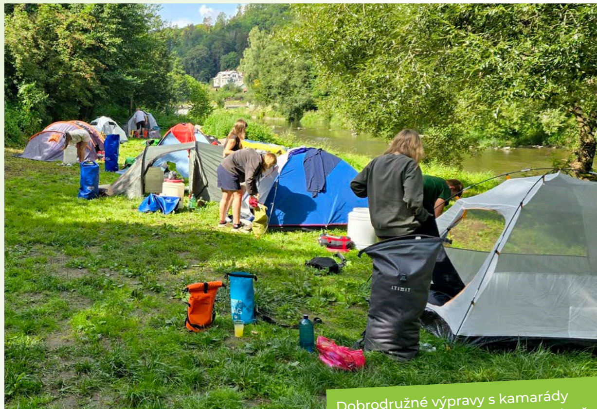
Vodácký tábor Sázava 2025 · DDM Kamarád Třemošná

Dobrodružné výpravy s kamarády pomáhají dozvědět se o ostatních věci, které by člověk jindy neslyšel. A právě to dělá z podobných expedic nezapomenutelný zážitek.