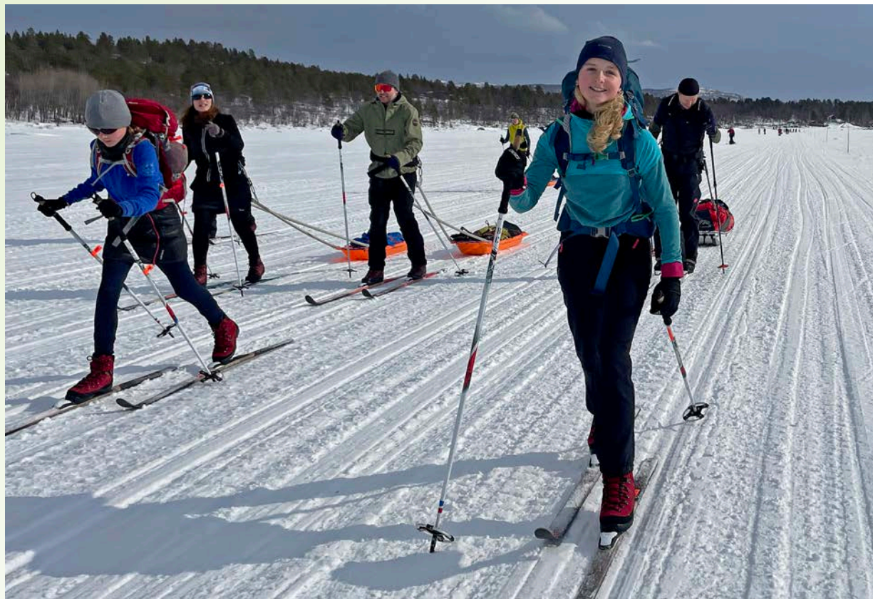
Skandie 2025 · Outward Bound CZ

Vracíme dobrodružství do výchovy našich dětí. Jen tak nám vyrostou generace odolných a odvážných lidí, kteří se nebojí riskovat a čelit výzvám dnešního světa.