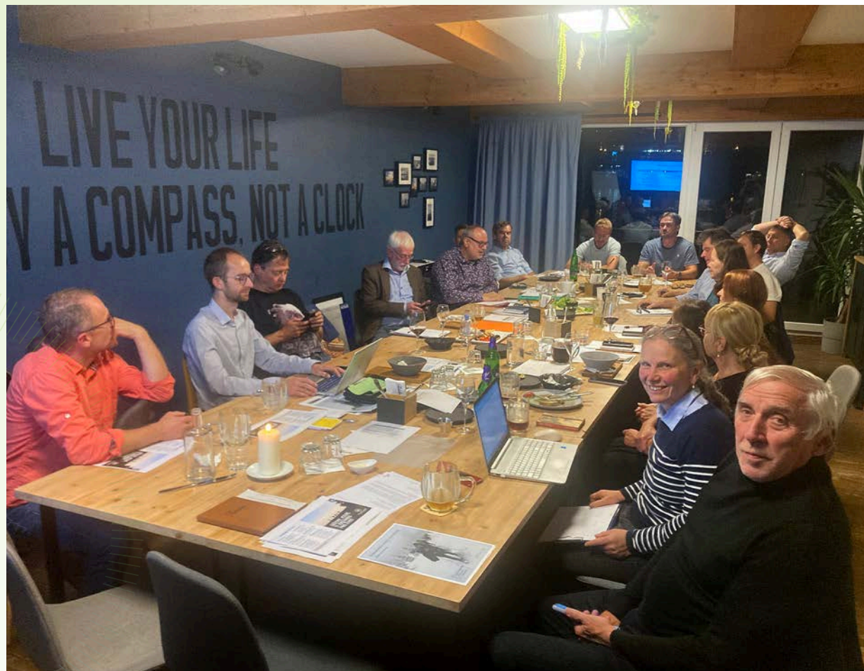
Patronium v říjnu 2025 · NF DVP

Správní rada měla v průběhu roku 2025 osm on-line jednání. Shromáždění všech patronů nadačního fondu, tzv. Patronium , proběhlo v lednu a říjnu. Poskytuje prostor pro koncepční zamyšlení nad směřováním fondu a zásadní rozhodnutí o investicích a prioritních činnostech na další období.