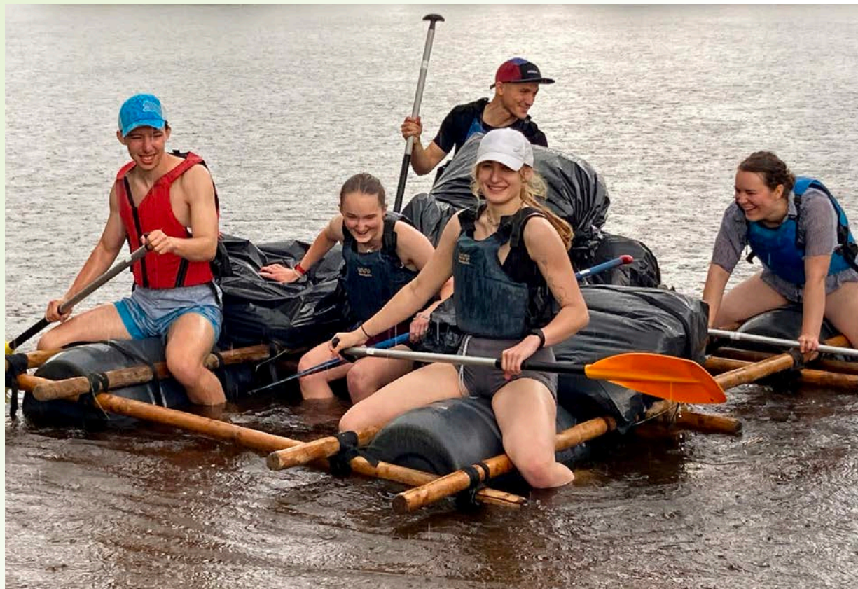
Time To Lead 2025 · Outward Bound CZ