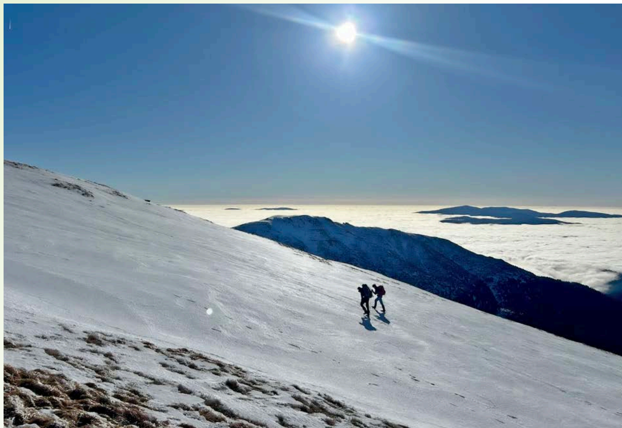
Skialpinistická expedice po slovenských horách · Česká tábornická unie – T.K. VYŠEHRAD Praha, p.s.

Naše civilizace stvořila bezpečný svět naplněný pohodlím. Strach z chyby, nehody a postihu sešněroval naše životy sítí regulací, vyhlášek a pravidel, psaných i nepsaných. Vykořenili jsme riziko z našich životů, a připravili se tak o jeho rozvojový potenciál, prostor k růstu nás všech. My to vidíme naopak a právo na dobrodružství považujeme za základní lidské právo.