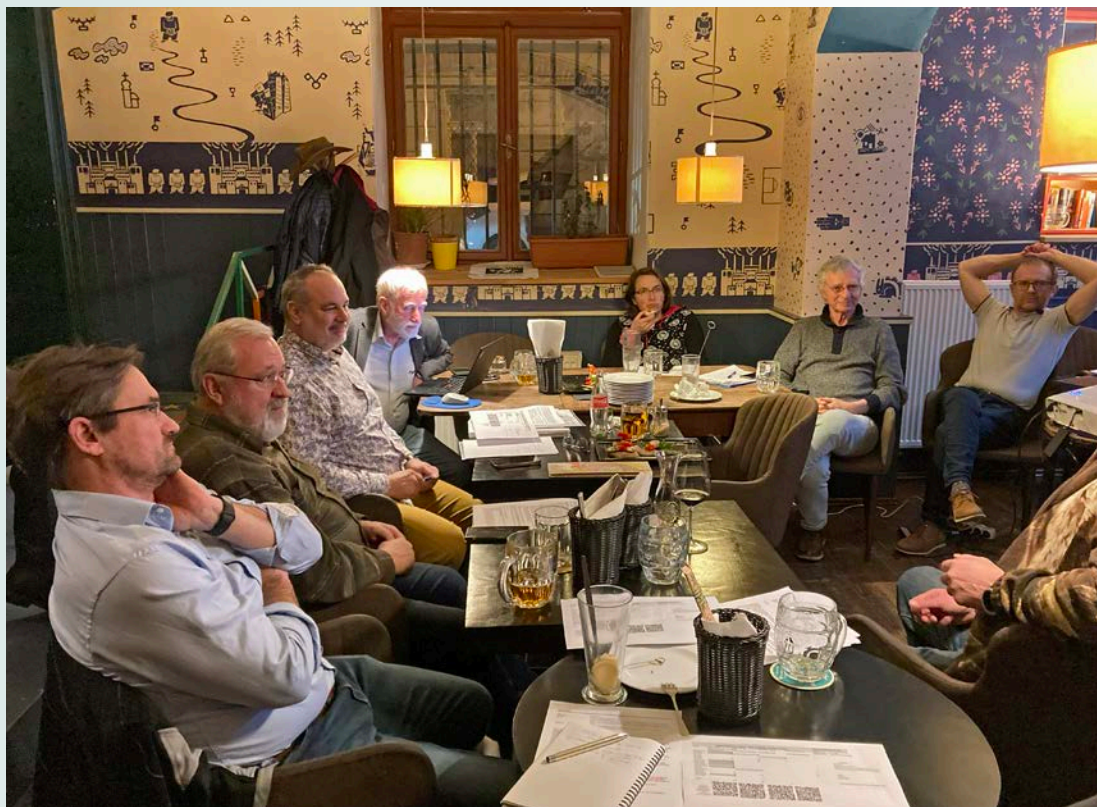
Zasedání Správní rady